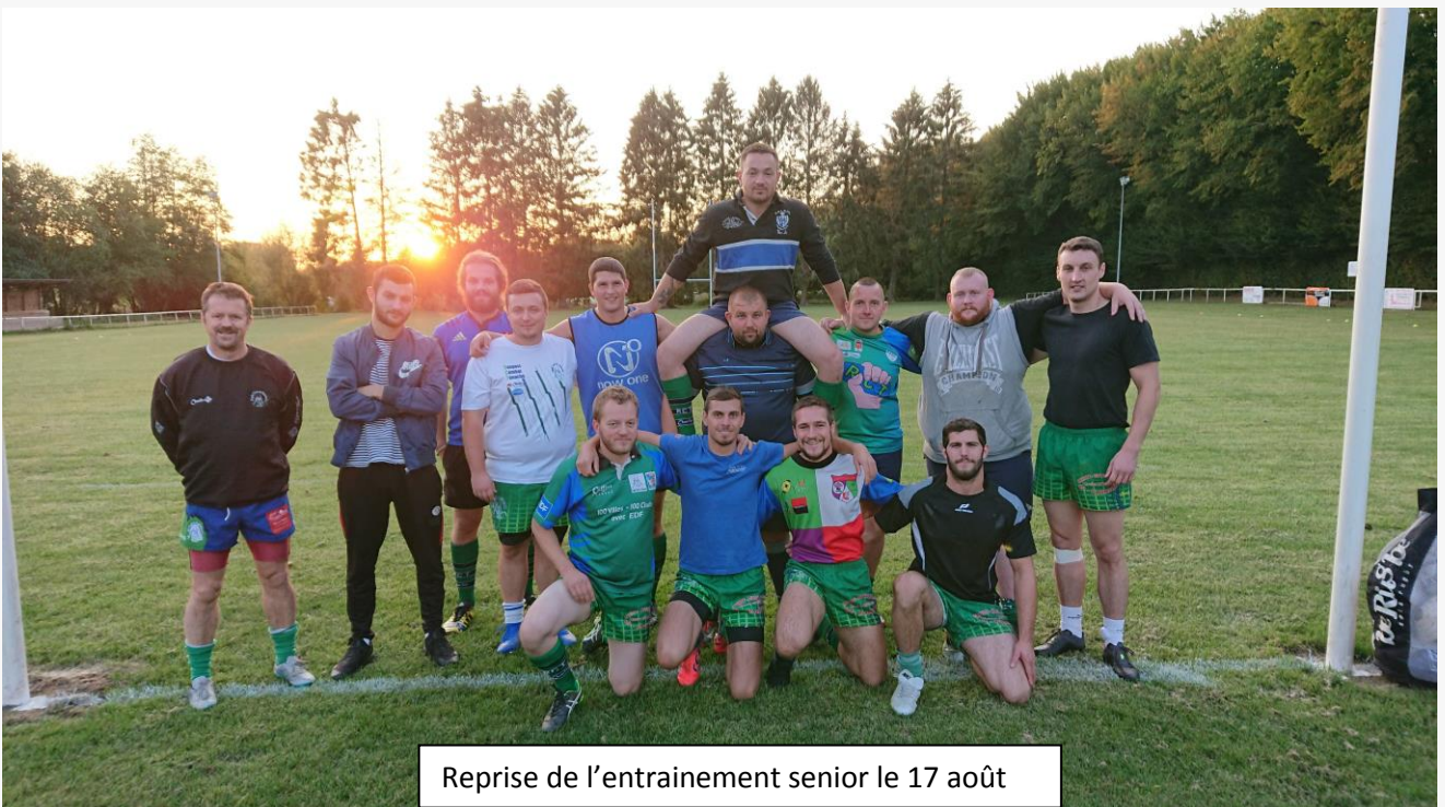
Reprise de l'entraînement senior le 17 août