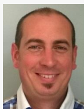
L'édito du président

Comme les écoliers, nous avons repris la direction du stade pour une nouvelle saison.